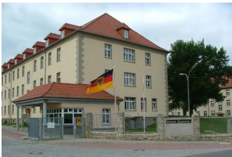
Henne-Kaserne SanUstgZ Erfurt Nissaer Weg 10 99099 Erfurt